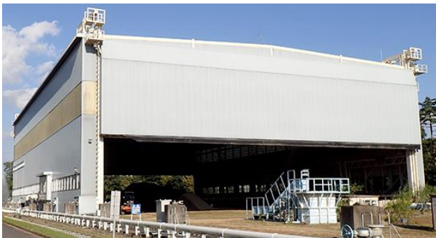
(防火防災部、総務部)

施設と大型降雨実験施設の2つを見学しました。どちらもその規模の大きさに驚かされるだけでなく、地震やゲリラ豪雨が引き起こす影響の研究がどのように進められているのか、その一端を知ることができました。