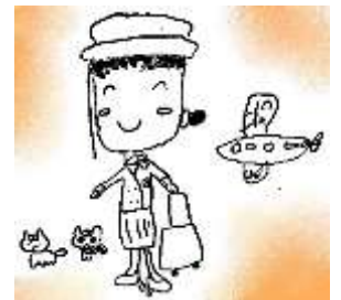
誰かが練習中に描いた傑作です

新1年生そしてまだ参加していない小学生の皆さん、一度遊びに来ませんか? 友達の輪を広げましょう。道具そして会費などは一切不要です。また、未就学児も準会員として参加できます。