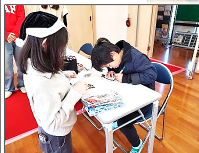
ワークショップ風景