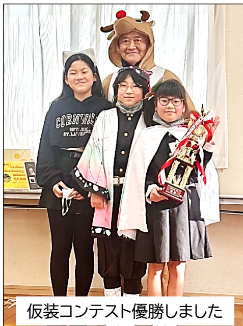
仮装コンテスト優勝しました

今後も、地域の皆さまに喜んでいただけるイベントを企画・実施してまいります。どうぞご期待ください！