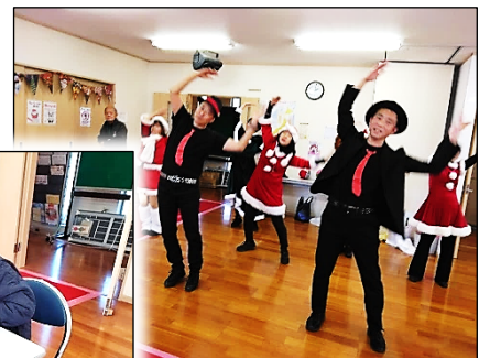
おやじダンサーズ